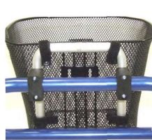
キャリアー+荷物カゴ