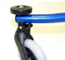
バンパーホイール