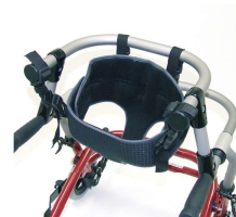
スリングシート+レール