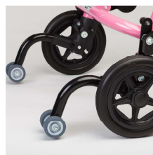
転倒防止バー (キャスター付き)