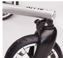
前輪スイングロック