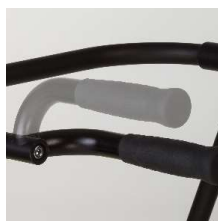
ユニバーサルハンドル