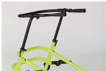
ストレートハンドル