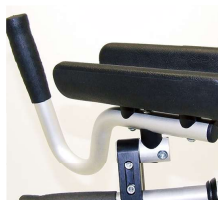
三次元調整式 前腕サポートハンドル