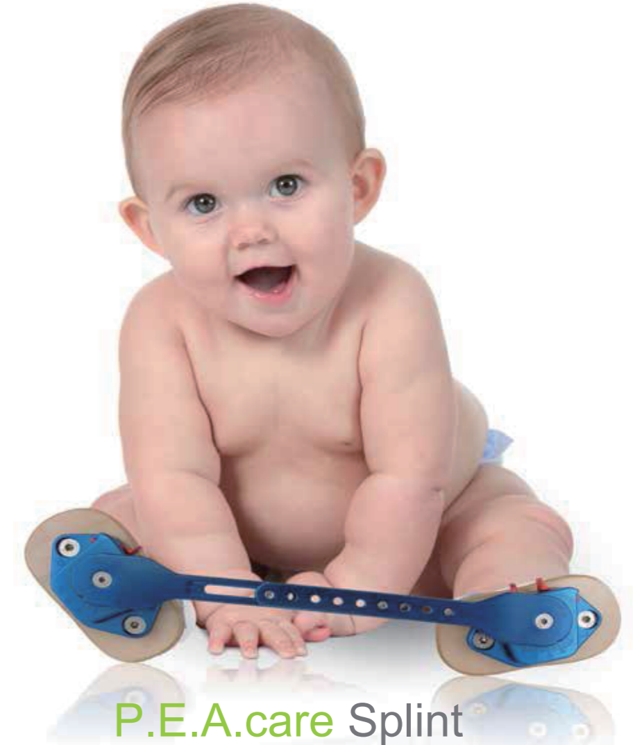
P.E.A.care Splint 内反足治療用スプリント