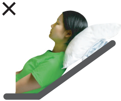
枕やタオルでの調整は不安定で前屈姿勢 が時間とともに崩れる