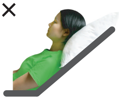
通常の枕では十分な前屈姿勢が作れず、 気道が開いている

今回、以上のような問題を解決するために、きくなん式摂食嚥下用安心まくら「らくちんゴックん」を提供いたします。