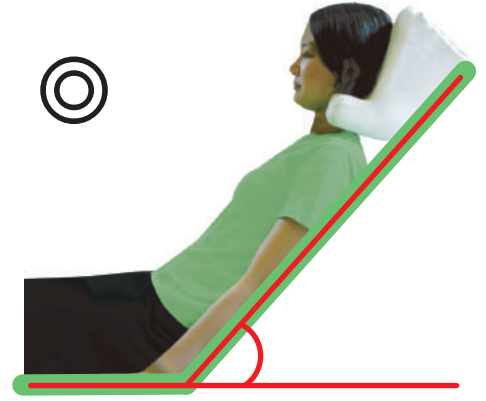
安定した頸部前屈姿勢で、 誤嚥予防に効果的です